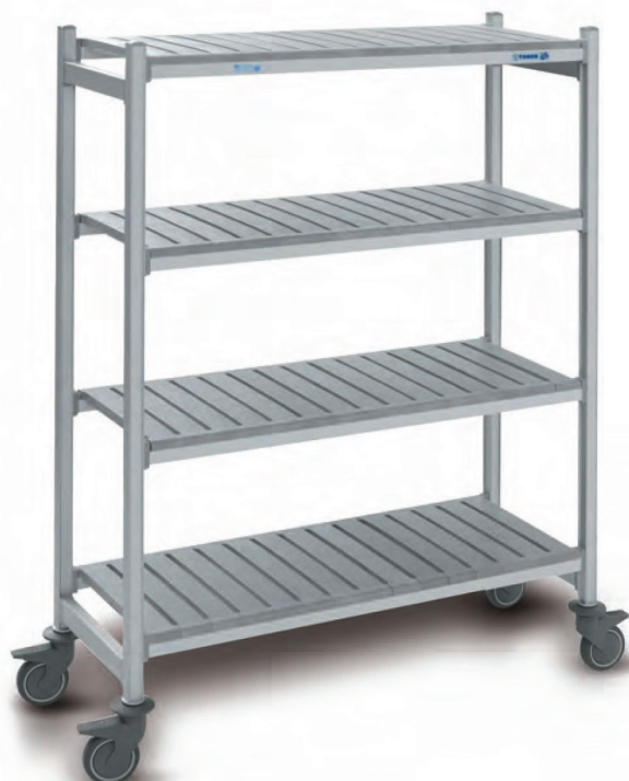
Тележка-стеллаж Н 1700