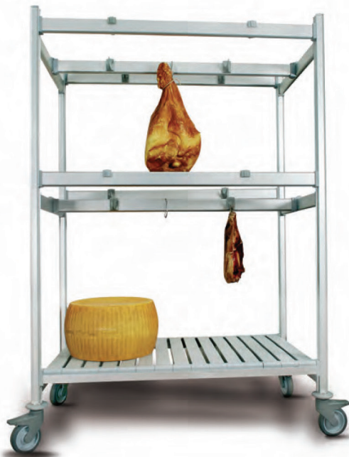
Тележка с подвесными элементами Н 1700