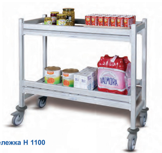
Тележка Н 1100