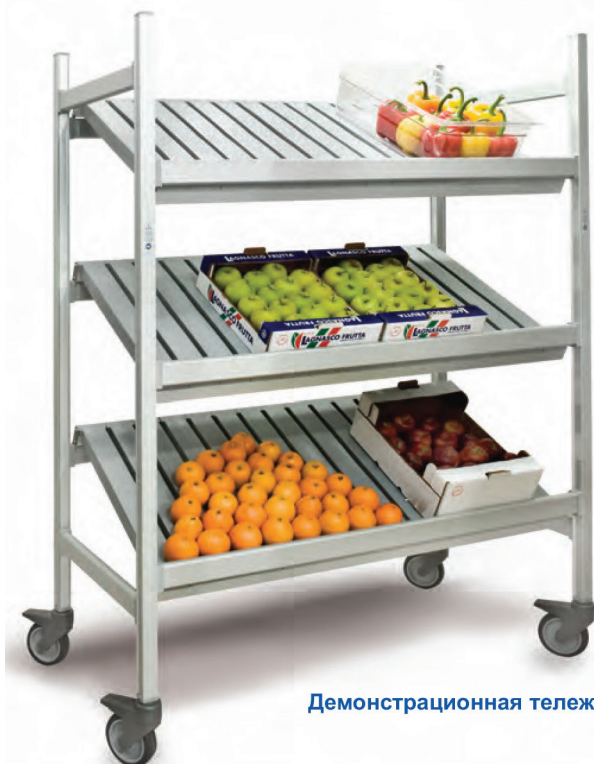
Демонстрационная тележка Н 1700

Дополнительные приспособления расширяют возможности системы: рейки и крюки для подвешивания, подставки под бутылки, держатели гастроемкостей и др.